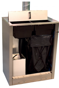
DRESTER WM-90-2 Ett utrymme för flytande och ett för fast avfall