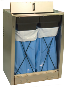
DRESTER WM-90-3 Deux compartiments pour déchets solides