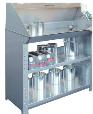
TABLE DE PEINTURE LACKY HERKULES