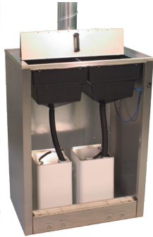
DRESTER WM-90-1 Deux compartiments pour déchets liquides