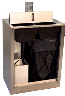
DRESTER WM-90-2 Un compartiment pour déchets liquides et un compartiment pour déchets solides